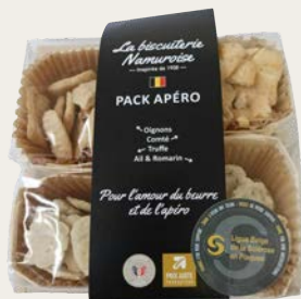
LE PACK APÉRO