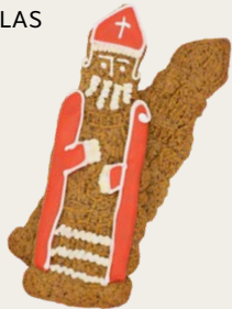
LES SPÉCULOOS SAINT-NICOLAS