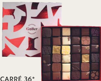
LE CARRÉ 36*