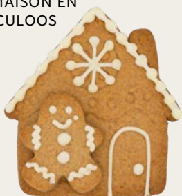
LA MAISON EN SPÉCULOOS