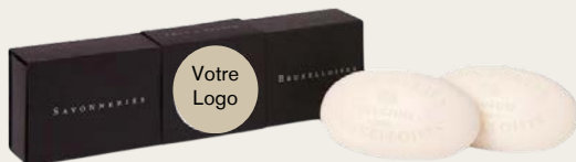
LE DUO DE SAVONS